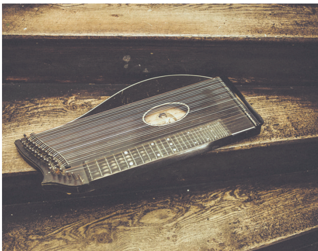
Elser's Zither aus dem KZ Dachau